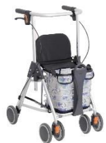
↑花柄アイボリー→ ←ネイビーの2色