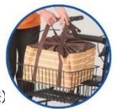
専用バッグ付(当社仕様)