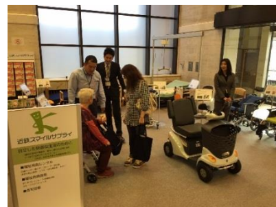
病院1階の当社ショールーム