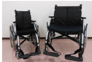
座幅も各種取り揃えています