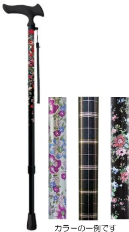
カラーの一例です