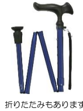
折りたたみもあります