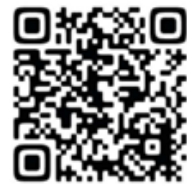
厚生労働省 YouTube QR コード