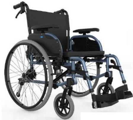
22 インチタイヤ タイプ

前輪 5 インチ~7 インチ、 後輪 16 インチ~24 インチと、 ご利用者の体格や症状により 組み合わせることが可能です。 また、座幅も 37.5cm~45cm の 4 種類で座面高も調節可能、耐荷重は 140kg です。