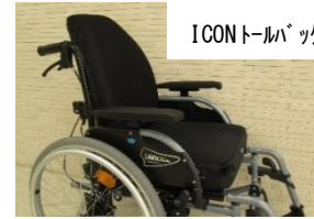
ICON トールバック取付例

近鉄スマイルサプライでは、軽量コンパクトなものから複雑なモジュール型までさまざまなタイプの車いすを取り扱っていますが、この車いす“ライナー30”を新たな「標準型」と位置付けて発表します。さらに、各種の付属品をつけることにより、適応範囲がさらに広がるベーシックモデルの車いすです。