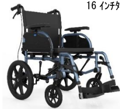
16 インチタイヤ タイプ